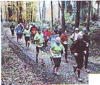
Ein Preis für die größte Gruppe

Favoriten siegen auf den langen Distanzen