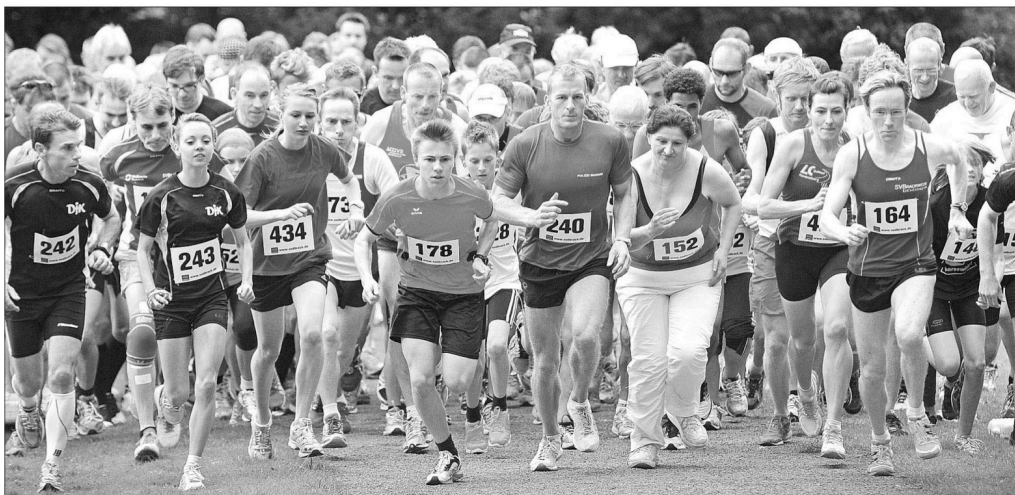
Auf geht's: Nach dem Startschuss gingen die 168 Starter vom 5000-Meter-Volkslauf auf die Strecke »Rund um den Meierteich«.