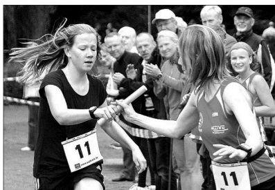
Perfekter Wechsel beim Staffellauf über 4 x 800-Meter vom Team des TSVE Bielefeld, welches sich Platz vier erlief.